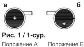
Рис. 1 / 1-сур.